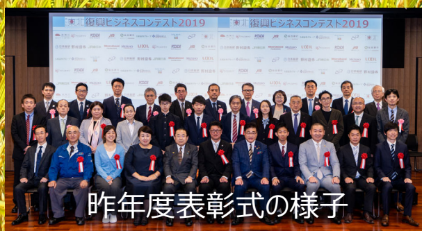
昨年度表彰式の様子